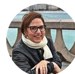
Ana Carro La Opinión 08-02-20