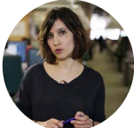
Ana Torres Menárguez El País 09-04-20