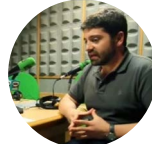
Javier Lorente El País 21-04-20