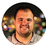
Jaime Gutiérrez rtve.es 07-03-20