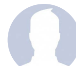
Desconocido abc 06-06-19