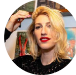
Sara Navas El País 01-05-19