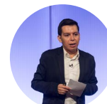
Víctor Núñez La Razón 03-03-20