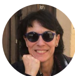
Celeste López La Vanguardia 19-09-19