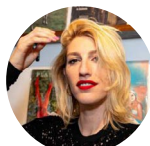
Sara Navas El País 01-05-19