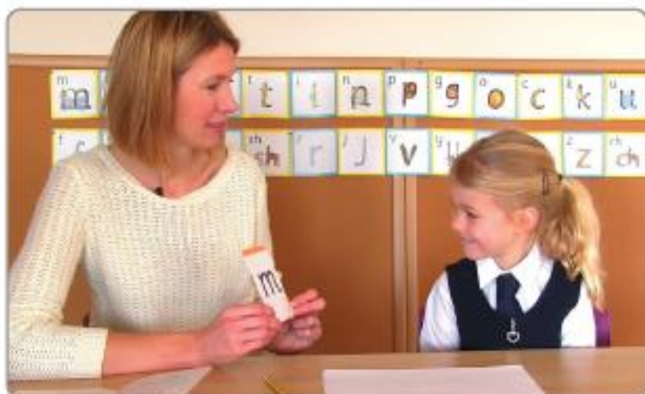
Învățarea Speed Sounds la clasă.