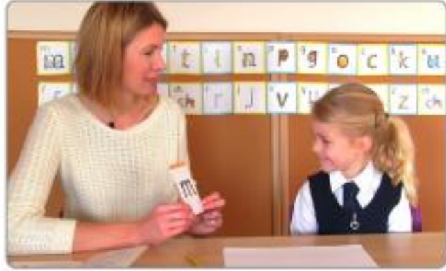
کلاس روم میں Speed Sounds سیکھنا۔

3. حرف والی سائیڈ پر ہر بار آوازیں تیز تر بولنے میں اپنے بچے کی مدد کریں۔ اگر وہ بھول جائے تو تصویر والی سائیڈ پر پلٹ لیں۔ جب آپ کا بچہ چیک کرنے کے لیے پلٹے بغیر آوازیں کہہ سکتا ہے تو رفتار بڑھائیں!