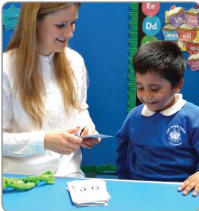
Nauka Speed Sounds w klasie.