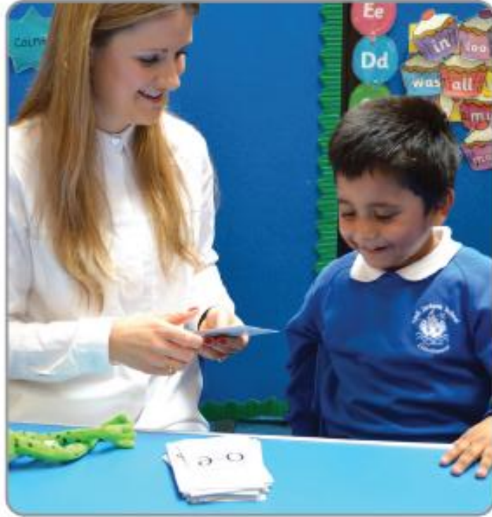
کلاس روم میں Speed Sounds سیکھنا۔

3. ان آوازوں کے ساتھ دہرائیں: oy ou ir air or ar اور پھر ان ساؤنڈ کارڈز کو اوپر والوں کے ساتھ ملا دیں۔ اس وقت تک مشق کرتے رہیں جب تک کہ آپ کا بچہ ان 12 آوازوں کو جلدی اور اعتماد سے نہ پڑھ لے۔