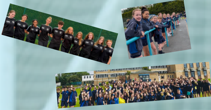
انقر لرؤية المزيد من الصور

شارك فريق الرقص الخاص بنا في بطولة العالم لمدارس الرقص، وقضينا يوماً رياضياً رائعاً، بالإضافة إلى حدث رياضي على مستوى المنطقة!