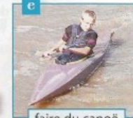
faire du canoë