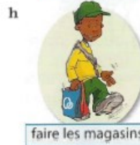
faire les magasins