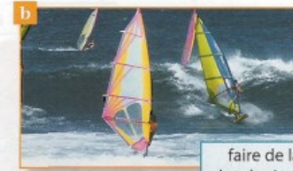
faire de la planche à voile