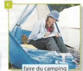
faire du camping