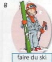
faire du ski