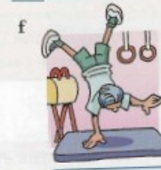
faire de la gymnastique