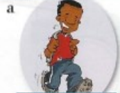
faire du sport