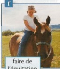
faire de l'équitation