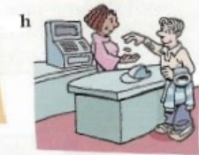
acheter des articles de sport