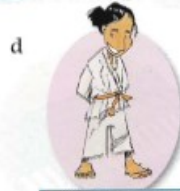
faire du judo