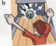
faire du bowling