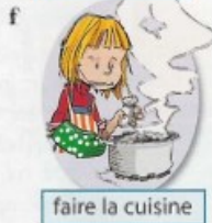
faire la cuisine