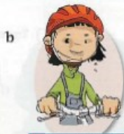
faire du vélo