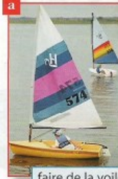
faire de la voile