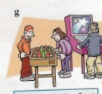
jouer au baby-foot et au flipper