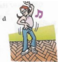
faire de la danse