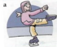
faire du patin à glace