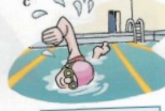
faire de la natation