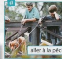
aller à la pêche