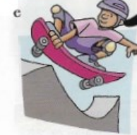
faire du skate