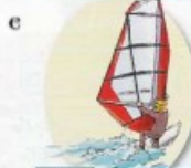
faire de la planche à voile