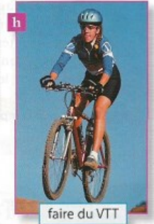
faire du VTT