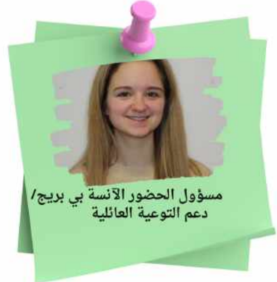
مسؤول الحضور الأنسة بي بريج / دعم التوعية العائلية