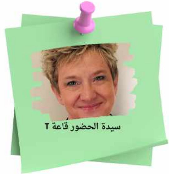
سيدة الحضور قاعة T

تلتزم مدرسة Werneth بتحقيق أقصى قدر من الإنجاز لجميع طلابنا. هناك علاقة واضحة بين الحضور الجيد والتحصيل التعليمي. هدفنا هو تعزيز الحضور المنتظم والالتزام الجيد بالمواعيد من أجل ضمان تحقيق جميع طلابنا إمكاناتهم.