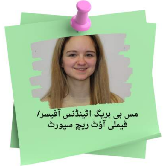
مس بی بریگ اٹینڈنس آفیسر / فیملی آؤٹ ریچ سپورٹ