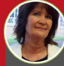
محترمہ جے ڈی اسسٹنٹ ہیڈ ٹیچر