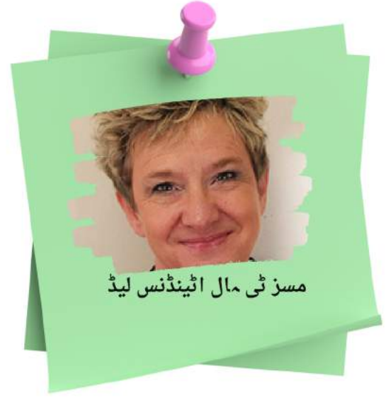
مسز ٹی مال اٹینڈنس لیڈ